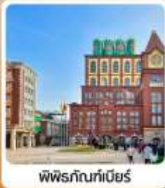
พิพิธภัณฑ์เบียร์