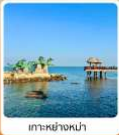
เกาะหย่างหม่า