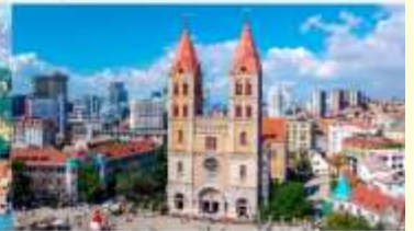
โบสถ์คริสต์เซนต์ไมเคิล

*ทางบริษัทฯ ขอสงวนสิทธิ์ในการสลับโปรแกรมทัวร์ตามความเหมาะสมขึ้นอยู่กับสถานการณ์หน้างาน โดยคำนึงถึงผลประโยชน์ของลูกค้าเป็นสำคัญ