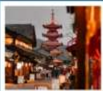
หมู่บ้านเหมียนฮวาวาน