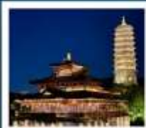
เมืองโบราณผู้หยวน

เมืองโบราณผู้หยวน / ภูเขาหินัวส์วซาน (รวมรถกอล์ฟ) ห้างสรรพสินค้าเต๋อจี / วัดจีหมิง / ทะเลสาบเซวียนอู่ ถนนอุ้งงต้าเต้า / อู๋ซีหมู่บ้านเหมียนฮวาวาน / เซาหูซิว เชียงใหม่ คลาสสิก ไนท์ / ถนนนานกิง / Tian An 1,000 Trees North Bund Green Land / Florentia Village Outlet