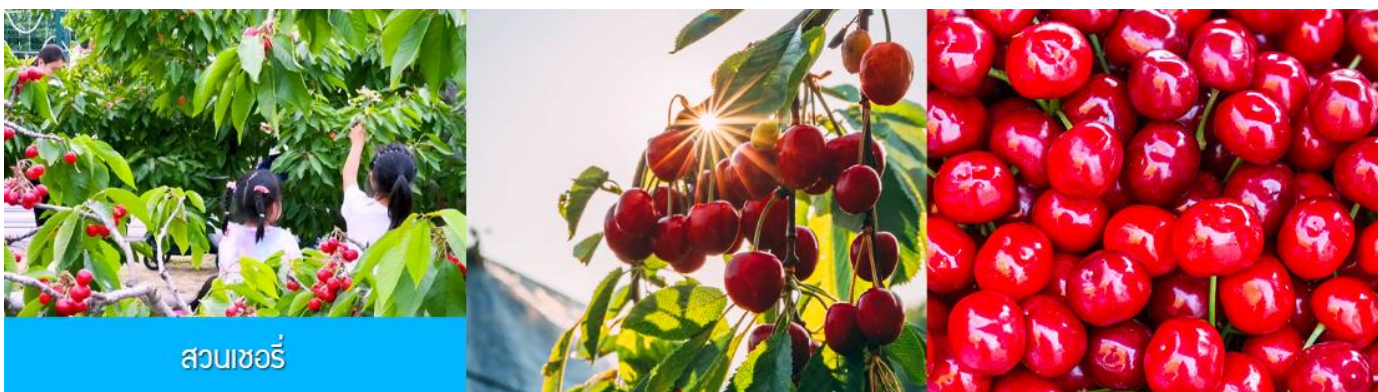
สวนเชอร์รี่

นำท่านสู่ สวนเชอร์รี่ 樱桃园现摘樱桃 ให้ท่านสัมผัสประสบการณ์สุดชิล ด้วยการเด็ดเชอร์รี่สดจากต้นภายในสวนเชอร์รี่ (เชอร์รี่จะของเมืองนี้จะเริ่มสุกและเก็บได้ในช่วงปลายเดือนพฤษภาคม - มิถุนายนของทุกปี ในกรณีที่ผลเชอร์รี่น้อยหรือหมดเร็วกว่าปกติ ทางทัวร์ขอสงวนสิทธิ์ในการจัดโปรแกรมอื่นแทนการเด็ดเชอร์รี่)