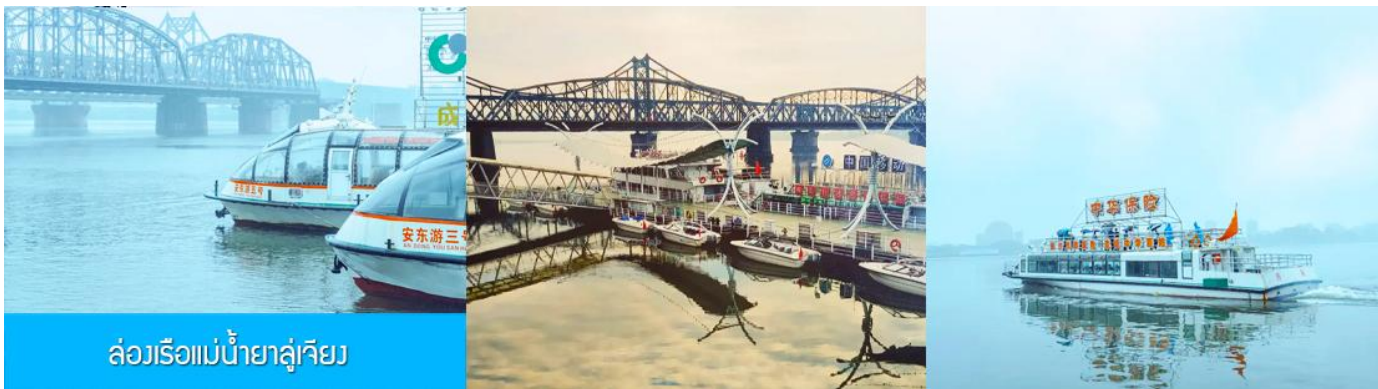
ล่องเรือแม่น้ำยาลู่เจียง

หลังอาหารให้ท่านพักผ่อนตามอัชชาศัยในโรงแรม