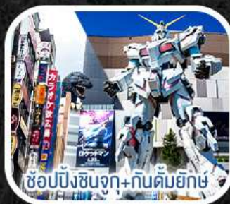
ช้อปปิ้งชินจูกุ+กันดั้มยักษ์