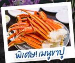
พิเศษ! เมฆงาปู