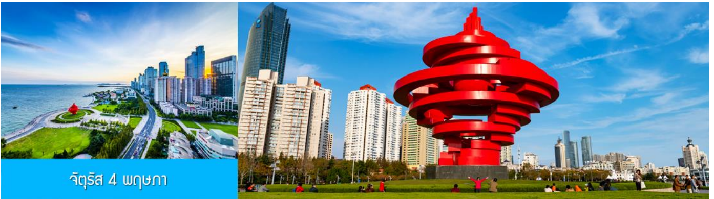
จัตุรัส 4 พฤษภาคม

จากนั้นนำท่านเที่ยวชม โรงเบียร์ชิงเต่า 青岛啤酒博物馆 พิพิธภัณฑ์เบียร์ที่ขึ้นชื่อของเมืองชิงเต่า ซึ่งเป็นเบียร์ยี่ห้อแรกที่ผลิตขึ้นในประเทศจีน ชมเบียร์ คอลเลกชั่นที่มียี่ห้อหลากหลายที่สุดของโลก และชมการจัดแสดงภาพและวิดิทัศน์เกี่ยวกับวิวัฒนาการของเบียร์ ขั้นตอนการผลิตและอื่น ๆ ที่เกี่ยวข้อง พร้อมชิมเบียร์ชิงเต่า ซึ่งเป็นเบียร์ที่ขายดีที่สุดในยี่ห้อหนึ่งของจีน.. (ชิมเบียร์ชิงเต่าท่านละ 1 แก้ว รับกลับอีก 1 ขวดเล็ก ตอนเดินออก)