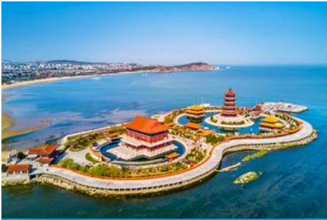
อุทยานทงเกี้ยวแปดเซียนข้ามทะเล