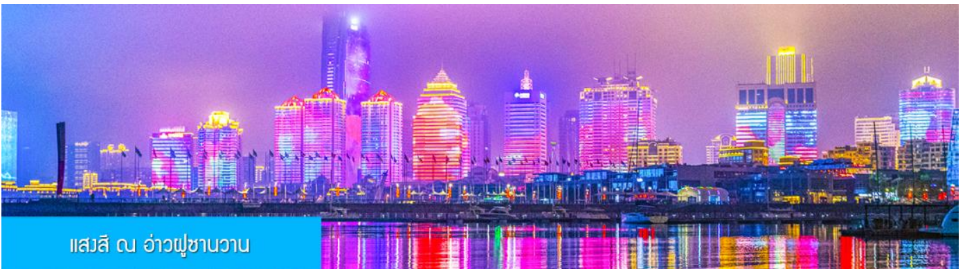
แอสสิ ณ อ่าวฟู่ซานวาว

ค่ำ รับประทานอาหารค่ำ ณ ภัตตาคาร *เมนูซีฟู้ด (3)