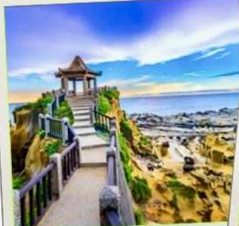
อุทยานเกาะเหอผิง