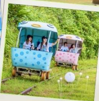
Shen'ao Rail Bike