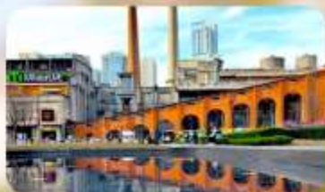
ตงเจียวจื่อ