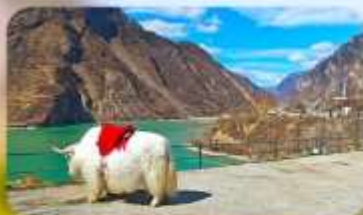
กะเลสาบเต๋อซี