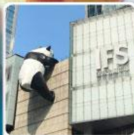
แพนด้ายักษ์ปีนตึกIFS