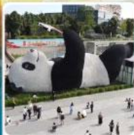
รูปปั้นแพนด้าเซลฟี