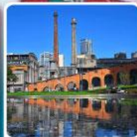
Eastern Suburb Memory Chengdu