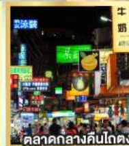
ตลาดกลางคืนโกตง