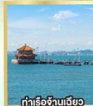
ท่าเรือจันทันเฉียว