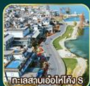
ทะเลสาบเอ๋อไห่คัง S