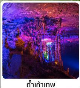
ดำเก้าทพ