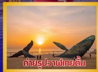
ต่ายรูปวาฬยักษ์ตื่น

สะพานจันเจียว-โบสถ์คาทอลิกชิงเต่า (ชมภายนอก)-ป่าตึกวน- พิพิธภัณฑ์เบียร์ชิงเต่า -ถนนคนเดินไท่ตง -ผิงไห่เก๋อ-ชายหาดและ จุดถ่ายรูปปลาวาฬยักษ์ตื่น -ถนนอ้าววีป่าเจีย-ชายหาดลากลอยไห้- จัตุรัสชิงฟู่หมิน-สวนเว่ยไห้ -สวนเยวี่ไห้-เกาะหยางหม่าย่าน - เมือง ท่าเหยียนไถ่-ท่าเรือชาวประมงเหยียนไถ่-ภูเขาเหยียนไถ่-จัตุรัส 54 -ศูนย์ โอลิมปิกเรือใบชิงเต่า-ภูเขาเหลาซาน-วัดไท่ซิงกง-สวนเลี้ยวมวยเต่า ชายหาดทะเลหมายเลข 3-อาคารไฟ้เทียน ชั้น 81- Cyber Punk