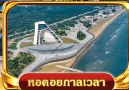
หอดอยกาลเวลา