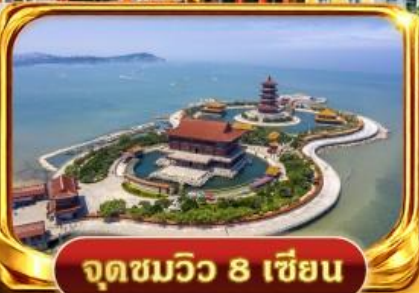
จุดชมวิว 8 เชียง