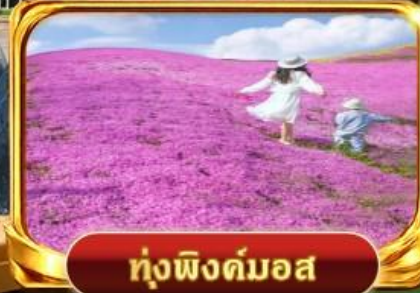
ทุ่งพิงค์มอส