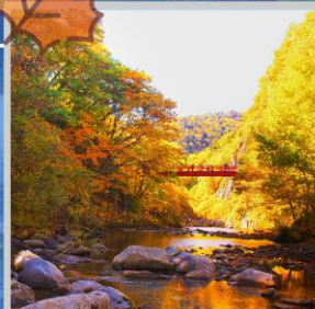
“JOZANKEI FUTAMI BRIDGE”