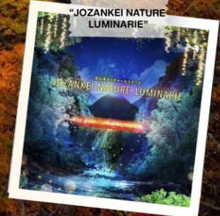
“JOZANKEI NATURE LUMINARIE”

วันเดินทาง 23 - 28 ต.ค. 2569 (วันปืยมหาราช) 28 ต.ค. - 2 พ.ย. 2569 30 ต.ค. - 4 พ.ย. 2569