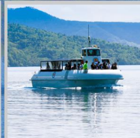
“LAKE SHIKOTSU GLASS BOAT”