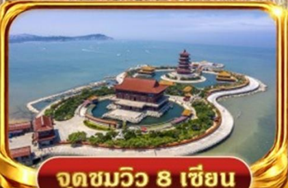
จุดชมวิว 8 เซียน