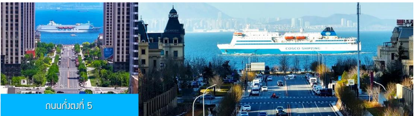
ถนนกั๋วตง 5