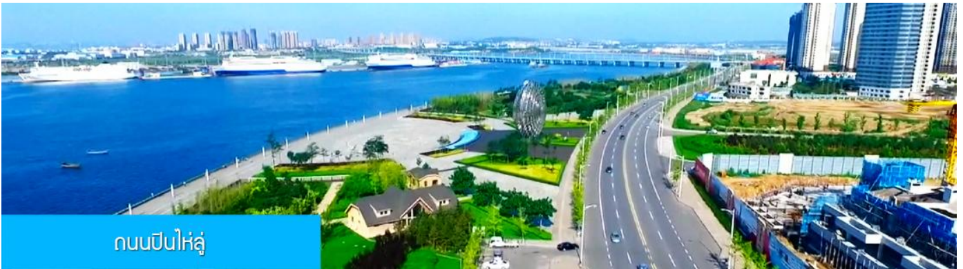
ถนนปินไห่ลู่

ล้อมด้วยตึกระฟ้าที่ทันสมัย ภายในมีบ่อน้ำพุคนตรี ลานหญ้าขนาดใหญ่ และลานกว้างสำหรับจัดกิจกรรม กลางแจ้ง อาทิ เทศกาลเบียร์นานาชาติ การแข่งขันวิ่งมาราธอน งานแฟชั่นนานาชาติเมืองต้าเหลียน ฯลฯ