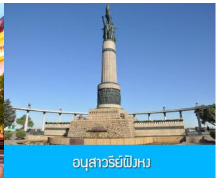
อนุสาวรีย์พิงหว