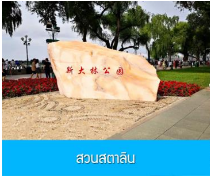
สวนสตาลิน