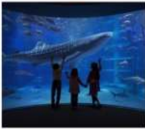
พิพิธภัณฑ์สัตว์น้ำโดยดั่ง