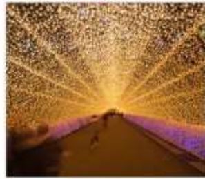
นาบนะโนะซาโตะ