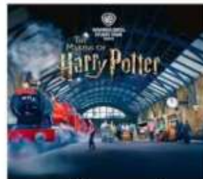
แฮร์รี่ พอตเตอร์ สตูดิโอโตเกียว