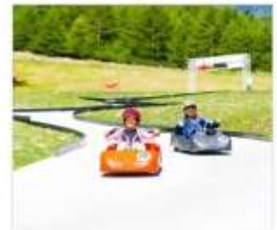
กิจกรรมขับโกคาร์ท