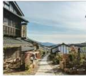
มาโกะเมะจุกุ