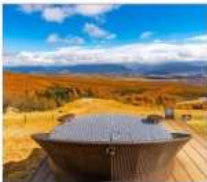
ดิโยซาโตะเทอเรส