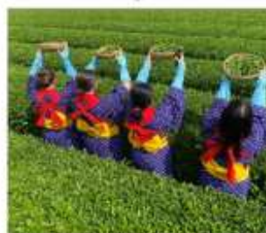
กิจกรรมเก็บชาみやโนเซ็น