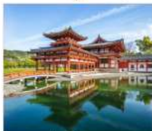
วัดเมียวโตจินและ ถนนซาเจียว