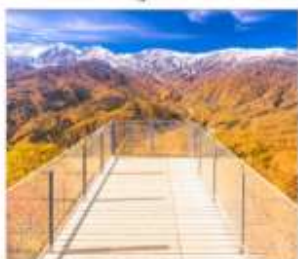
นั่งกระเช้าฮาคูมะ