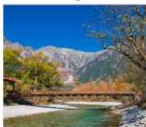
ดามิโดจิ