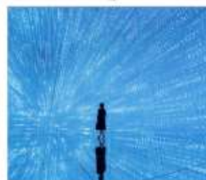
ทีมแค้นแพคนเน็ต