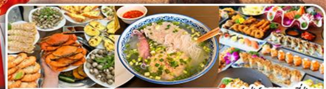
บุฟเฟ่ต์ซีฟู้ด