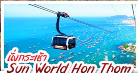
นั่งกระเช้า Sun World Hon Thom