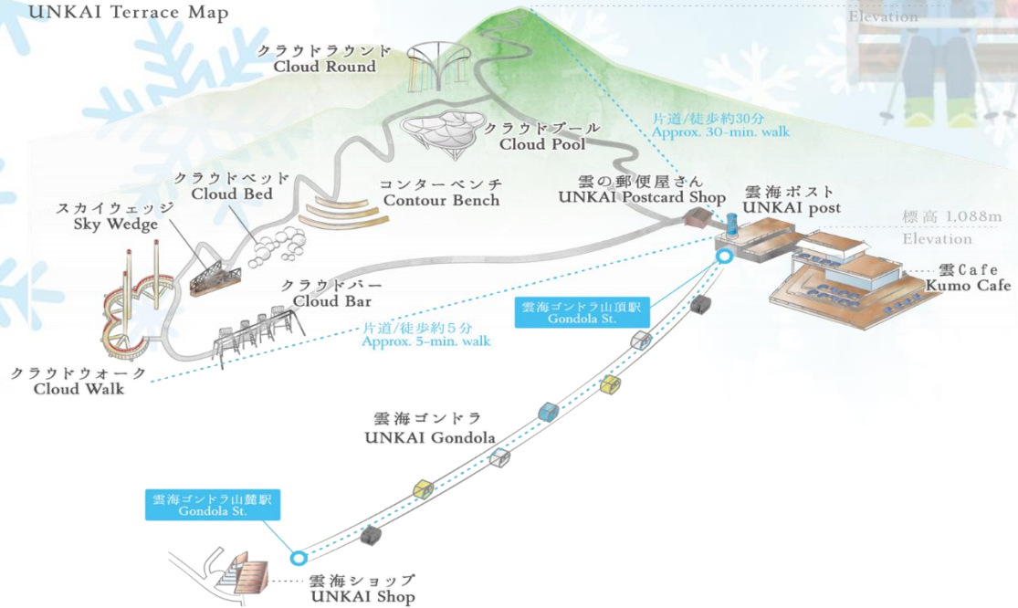
雲海テラスマップ UNKAI Terrace Map

เดินทางสู่ เมืองอาซาฮิคาว่า เป็นเมืองที่ใหญ่เป็นอันดับสองของเกาะฮอกไกโด รองจากนครซัปโปโระมีร้านค้าที่ขายข้าวและผักที่ปลูกได้ในเมือง และยังมีร้านอาหารทะเลตั้งอยู่มากมาย การคมนาคมสมบูรณ์แบบ ทำให้แต่ละปีมีผู้มาท่องเที่ยวกว่า 5 ล้านคนจากทั้งในและต่างประเทศ