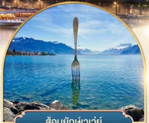
ส้อมยักเข่าเว้ย