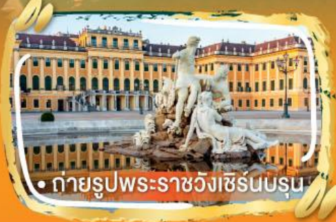
• ถ่ายรูปพระราชวังเชรินบรุน