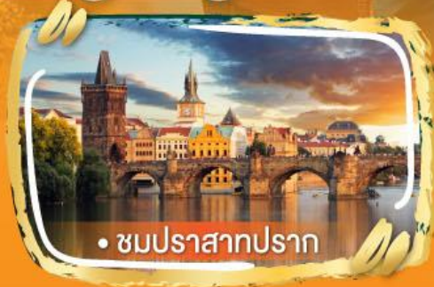
• ชมปราสาทปราก