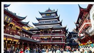
ตลาดร้อยปีเฉิงหวงเมี่ย