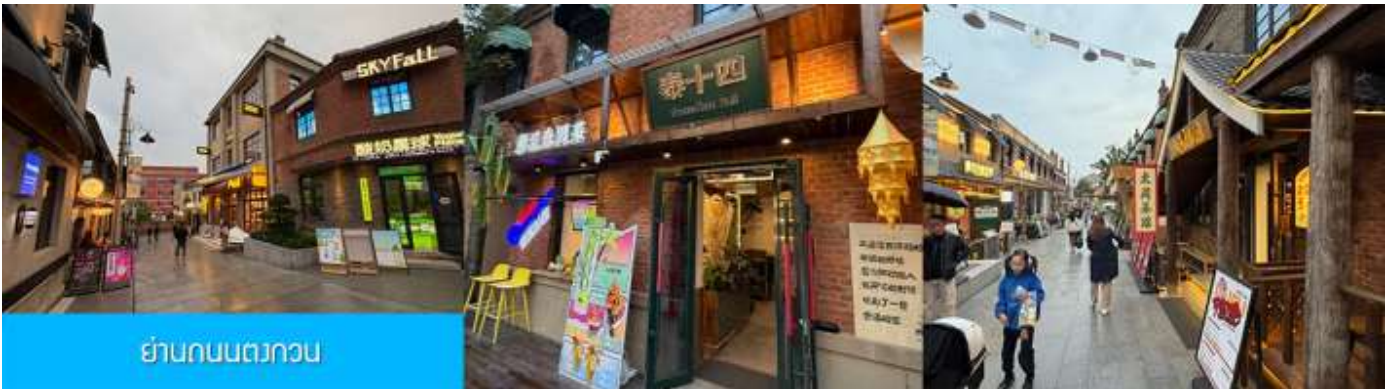
ย่านถนนตวงวน