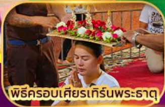
พิธีครอบเศียรเทีร์นพระธาตุ