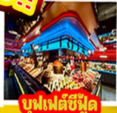
บุฟเฟ่ต์ซีฟู้ด