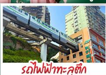
รถไฟฟ้าทะเล่สุติก