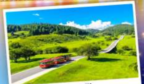
เจานางฟ้า