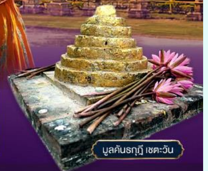
มูลคันทฤกฏี เขตเววัน