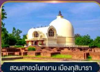
สวนสาละวินทยาน เมืองกุสินารา