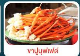
ชาบูบุฟเฟ่ต์