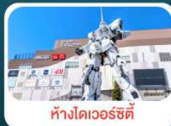
ห้างไดเวอร์ซิตี