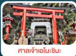
ศาลเจ้าอิเนะชิมะ