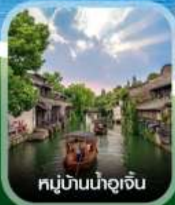
หมู่บ้านน้ำจู้เจิน