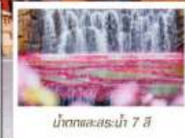
น้ำตกและสระน้ำ 7 สี