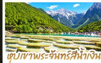
เขื่อนเขาพระจันทร์สีน้ำเงิน