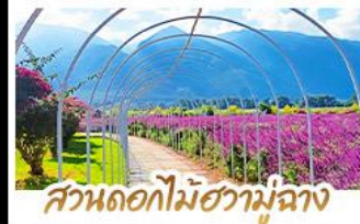
สวนดอกไม้ฮามูฉาง