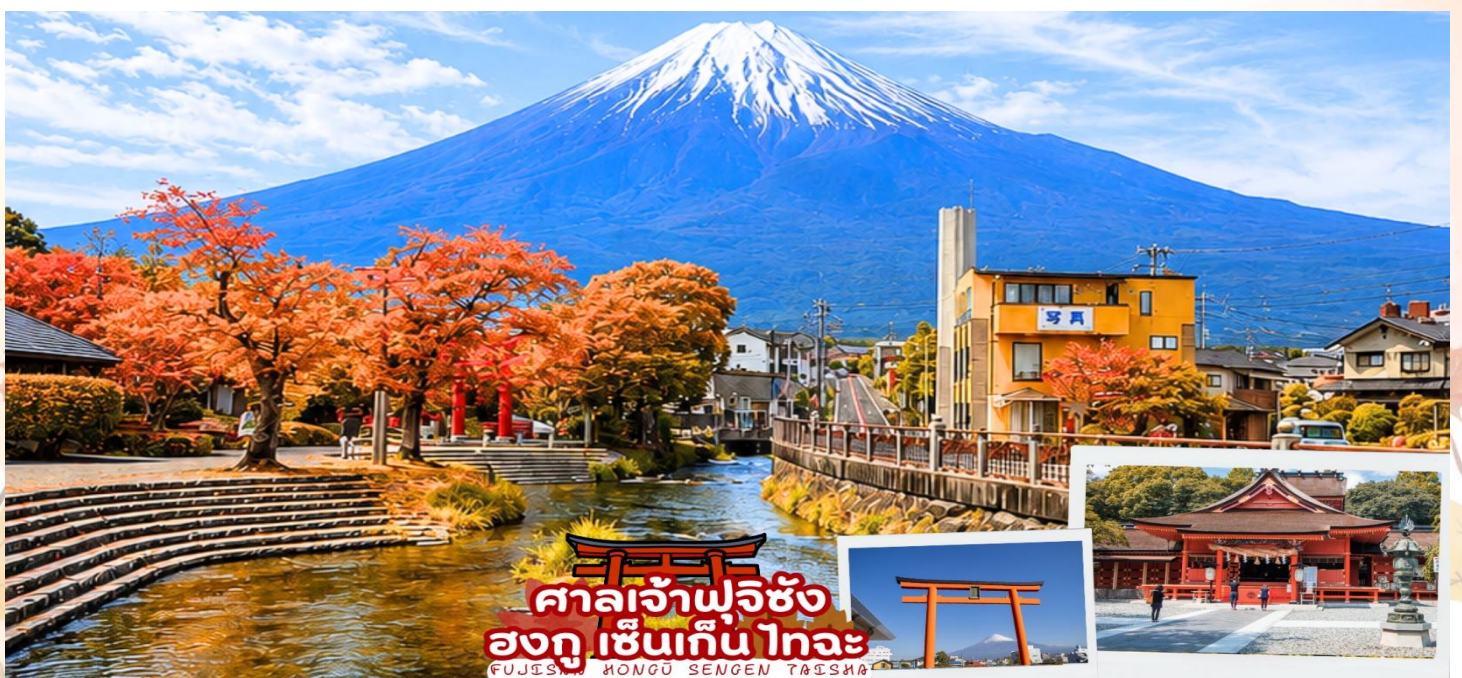
ศาลเจ้าฟูจิซัง ฮงกุ เซ็นเกิน ไทอะ FUJISAN HONGU SENGEN TAISHA

ศาลเจ้าฟูจิซัง ฮงกุ เซ็นเกิน ไทอะ (Fujisan Hongū Sengen Taisha) เป็นศาลเจ้าชินโต ตั้งอยู่ทางทิศตะวันตกเฉียงใต้ของฐานภูเขาไฟฟูจิ ในเมืองฟูจิโนะมิยะ จังหวัดชิซุโอกะ ครอบคลุมตั้งแต่ฐานภูเขาไฟฟูจิ ไปจนถึงยอดภูเขา ภายในศาลเจ้าเต็มไปด้วยความสงบ มีทั้งสถาปัตยกรรมแบบญี่ปุ่นโบราณ บ่อน้ำศักดิ์สิทธิ์ และวิวของภูเขาฟูจิที่งดงาม ศาลเจ้าแห่งนี้ตั้งอยู่ในตำแหน่งที่สามารถมองเห็นวิวภูเขาไฟฟูจิได้อย่างสวยงาม ด้วยบรรยากาศที่เงียบสงบและธรรมชาติรอบข้างสวยงาม ด้านหน้ามีน้ำไหลผ่านพร้อมกับเสาโทริสีแดง และภูเขาฟูจิ ทำให้ที่ศาลเจ้าแห่งนี้เป็นอีกหนึ่งจุดชมวิวภูเขาฟูจิและการถ่ายภาพที่สวยงามมาก