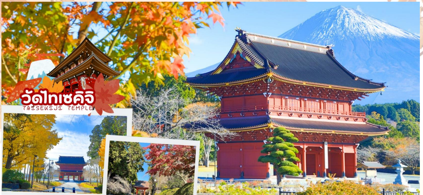
วัดไทเซคิจิ TAISEKIJJI TEMPLE

กลางวัน รับประทานอาหารกลางวัน ณ ร้านอาหาร (มื้อที่ 3)