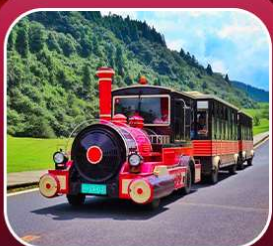
"อุทยานเขานางฟ้า"