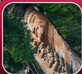
"ผืนหินแกะสลักต้าจู้"