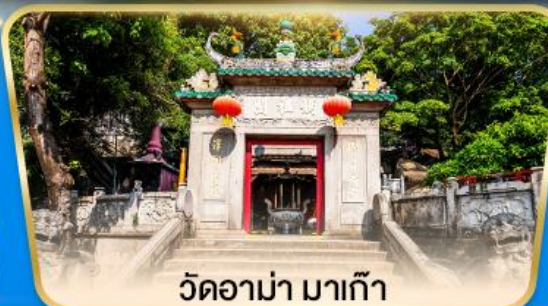
วัดอามา มาเก๊า