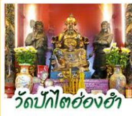
วัดปึกโตย่องฮ่า