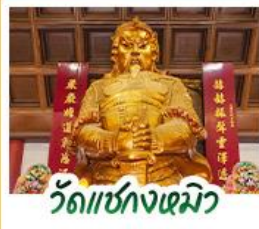
วัดเซกทงหิว