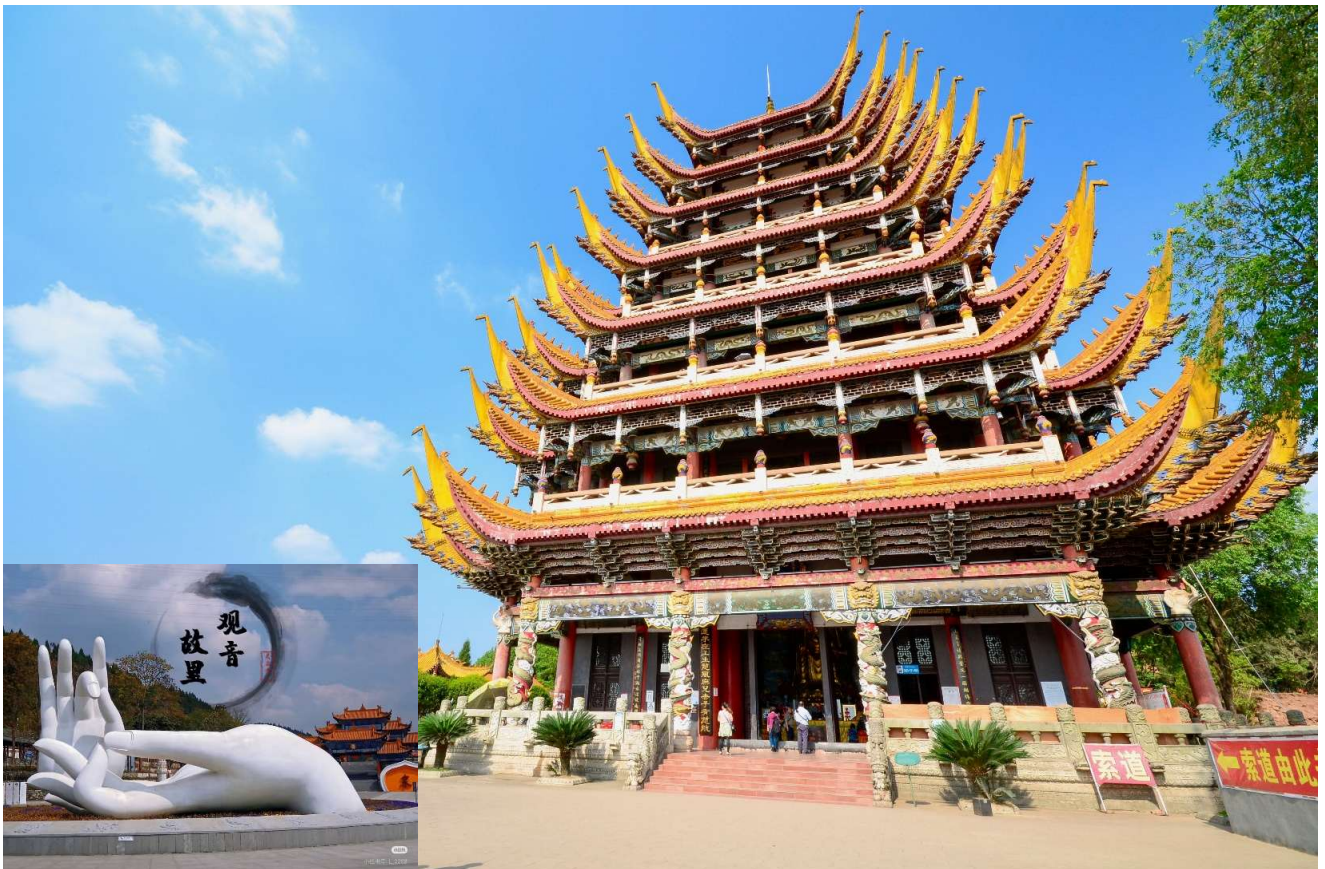
T2G-CKG36FD ฉงชิ่ง กวางอู่ชาน...วัดหลิงฉวน ต้าจู่ ชมถนนแปะก๊วย 5D 4N (FD)

จากนั้นนำท่านเดินทางสู่ วัดหลิงฉวน (Lingquan Temple) หรือ วัดเจ้าแม่กวนอิมกระพริบตา เป็นวัดเก่าแก่ซึ่งสร้างขึ้นในปลายราชวงศ์สุย (ค.ศ. 581 - 618) และบูรณะพัฒนาต่อเนื่องมา มีความเชื่อว่าเป็นวัดที่มีความศักดิ์สิทธิ์อย่างมาก มีเรื่องเล่ากันว่า เมื่อครั้งเกิดแผ่นดินไหวที่มณฑลเสฉวน ชาวบ้านที่มาสักการะเห็นเจ้าแม่องค์นี้ได้กระพริบตาและหลั่งน้ำตา เสมือนท่านส่งสารชาวผู้ประสบภัย ภายในวัดแห่งนี้ยังได้แสดงประวัติของเจ้าแม่กวนอิม วิหารเจ้าแม่กวนอิม ภายในวิหารเจ้าแม่กวนอิม มีองค์เจ้าแม่กวนอิมยืนสูง 18.6 เมตร