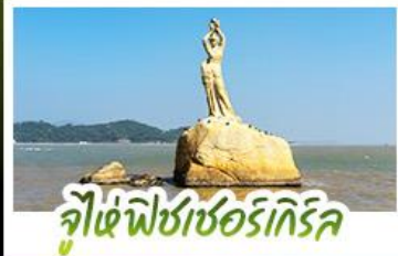
จูไห่พีชเชอร์เกอร์ริค

เดิมค้าบรรยากาศสุดคลาสสิกสไตล์อังกฤษ ณ THE LONDONER MACAO ไหว้พระ-ตั้ง 3 วัตถุประสงค์ ขอพรการทำงาน การเงิน ความรัก ครอบงมในรูปเดียว ชมความวิจิตรตระการตาของพระราชวังหยวนหมิงหยวนใหม่แห่งจูไห่ ช้อปปิ้งจุใจ ย่านจิมซาจุ่ยและถนนคนเดินฟู้ทิวฮิลล์