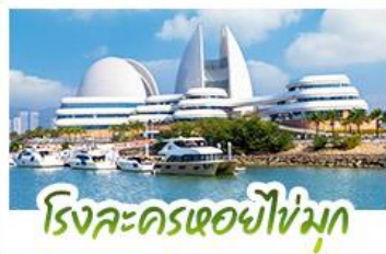
โรงละครเซอซิงมุก