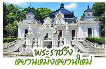
พระราชวัง เฉวานเหมิงเฉวานหนี่เหม่