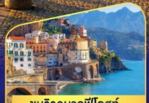
ชมวิวมอลฟีโคสก์