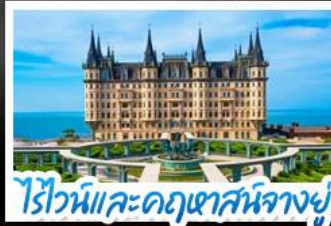
ไร่ไวน์และคฤหาสน์นางยู