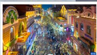
ถนนคนเดินจงยาง