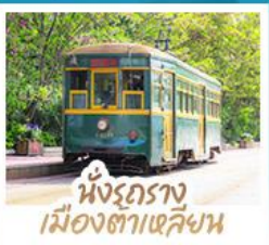
นั่งรถราง เมืองต้าเหลียน