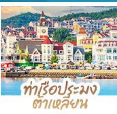
ทำเรือประมง ต้าเหลียน