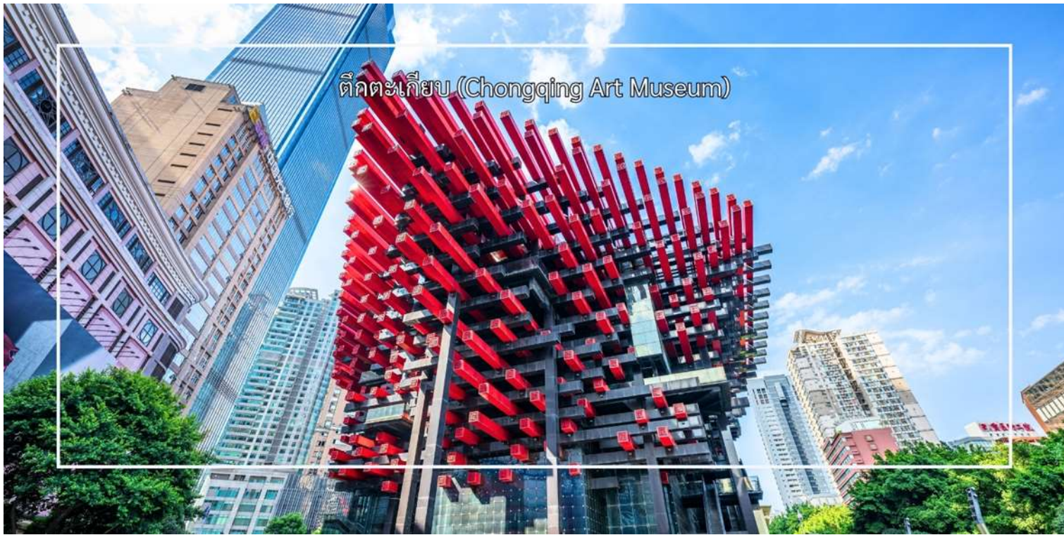
ตึกตะเกียบ (Chongqing Art Museum)

นำท่านสู่ ถนนคนเดินเจี๋ยฟางเป่ย์ (Jiefangbei Pedestrian Street) ย่านการค้าและแลนด์มาร์กสำคัญที่สุดแห่งหนึ่งของเมือง ฉงชิ่ง และได้รับการขนานนามว่าเป็น "ถนนสายแรกแห่งจีนตะวันตก" โดยมีอนุสาวรีย์ปลดปล่อยประชาชน (Jiefangbei Monument) ตั้งอยู่ใจกลางย่านแห่งนี้ ที่นี่คือหนึ่งในแหล่งช้อปปิ้งและท่องเที่ยวที่สำคัญที่สุดในเมืองฉงชิ่ง (Chongqing) เป็นพื้นที่ที่มีชีวิตชีวาและคึกคัก ถนนนี้ตั้งอยู่ใกล้กับสถานที่ท่องเที่ยวสำคัญอื่นๆ เช่น ตึกตะเกียบ ทำให้สามารถเดินเที่ยวชม เดินเล่น ถ่ายภาพ ได้อย่างสะดวก ถนนสายนี้มีบรรยากาศที่มีชีวิตชีวา และยังเต็มไปด้วยร้านค้าสินค้าแบรนด์เนมร้านสินค้าท้องถิ่นและร้านค้าขายสินค้าต่างๆ เช่น เสื้อผ้าเครื่องประดับและของที่ระลึก