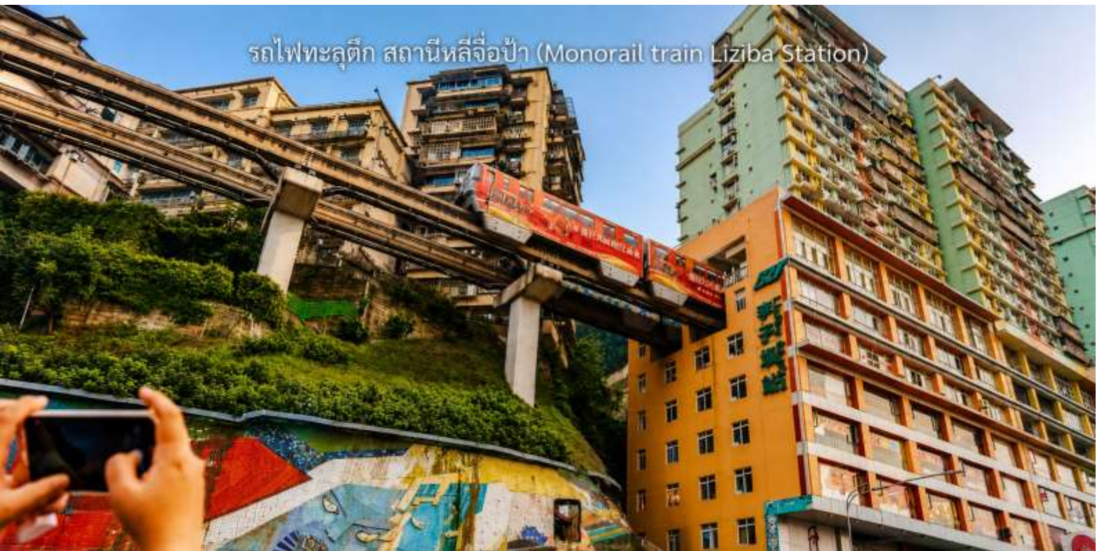
รถไฟทะลุตึก สถานีหลี่จื่อป่า (Monorail train Liziba Station)

จากนั้นนำท่าน นั่งรถไฟทะลุตึก (Monorail Train) หนึ่งในประสบการณ์ที่น่าสนใจและเป็นเอกลักษณ์ในเมืองฉงชิ่ง รถไฟเส้นนี้มีเส้นทางที่ผ่านอาคารและที่อยู่อาศัย ทำให้ผู้โดยสารรู้สึกเหมือนกำลังนั่งรถไฟที่ทะลุผ่านตึกสูง เส้นทางที่น่าสนใจในรถไฟนี้รวมถึงสถานีที่มีชื่อเสียง เช่น สถานีหลี่จื่อป่า (Liziba Station) ซึ่งตั้งอยู่ในพื้นที่ที่มีความหนาแน่นของประชากร การนั่งรถไฟทะลุตึกนี้เป็นวิธีที่ยอดเยี่ยมในการสัมผัสกับวัฒนธรรมเมืองฉงชิ่งและชื่นชมกับการพัฒนาเมืองที่น่าทึ่ง หากคุณมีโอกาสไปเยือนฉงชิ่ง อย่าลืมนั่งรถไฟเส้นนี้เพื่อสัมผัสประสบการณ์ที่ไม่เหมือนใคร