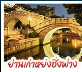
ย่านเก่าแห่งซิงฟาง