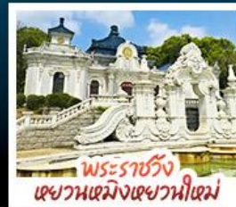
พระราชวัง เขาวงมั่งเขาวงหนีเมม