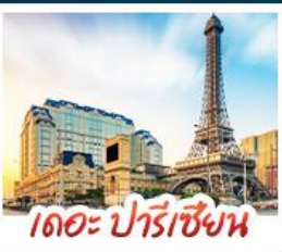
เดอะ ปารีสเซียน

สัมผัสบรรยากาศ เดอะ เวเนเซียน มาท้าวูไ้ เสมือนได้เยือนลาสเวกัส ชมความวิจิตรตระการตาของพระราชวังหยวนหมิงหยวนใหม่แห่งจุไห้ เช็กอินกับแลนด์มาร์กสุดฮิตจตุรัสฮวาเล็งถ่ายรูปลูกับหอทีวีของกวางเจา เที่ยวชมหมู่บ้านสไตล์ยุโรปแห่งใหม่ของเซินเจิ้น • ช้อปปิ้งเพลิน ๆ ที่ ห้างสรรพสินค้า COCO PARK ถนนคนเดินฟู้หัวหลี่และถนนคนเดินบิกทิง