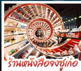
ร้านหนังสือจุงซูเกอ