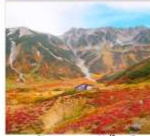
เส้นทางสายอัลไพน์ ทาเทยาม่า