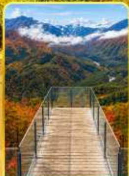
ซากุระฮิวาตากะ