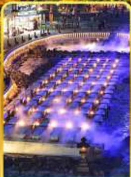
ชมยูบารากะ