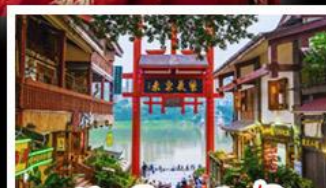
หมู่บ้านโบราณฉือซีโจว