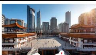
ตึกขุยซิง

พระแกะสลักหินต้าจู้ - หลุมฟ้าสะพานสวรรค์ - เจานางฟ้า ตึกขุยซิง - ตึกตะเกียบ - หมู่บ้านโบราณฉือซีโจว