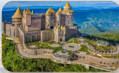
ปราสาทจันทร์

ท่าเทียบเรือกระเช้ายาวที่สุดในโลกได้รับการบันทึกสถิติโดย WORLD RECORD ประเภท NON STOP กระเช้านี้มีความยาวถึง 50.42 เมตร