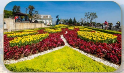
สวนดอกไม้ Le Jardin D'Amour