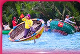
ล่องเรือกระดัง หมู่บ้านกิมทาน