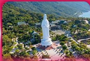
องค์กวนอิม วัดหลินอิ่ง