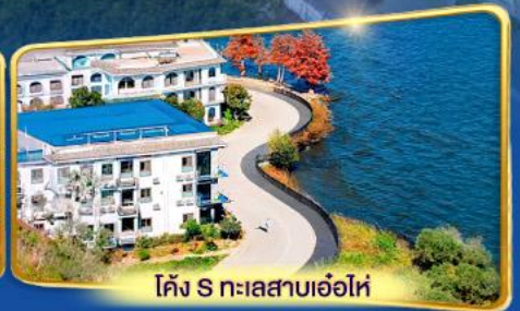
โค้ง S ทะเลสาบเอ่อไห่